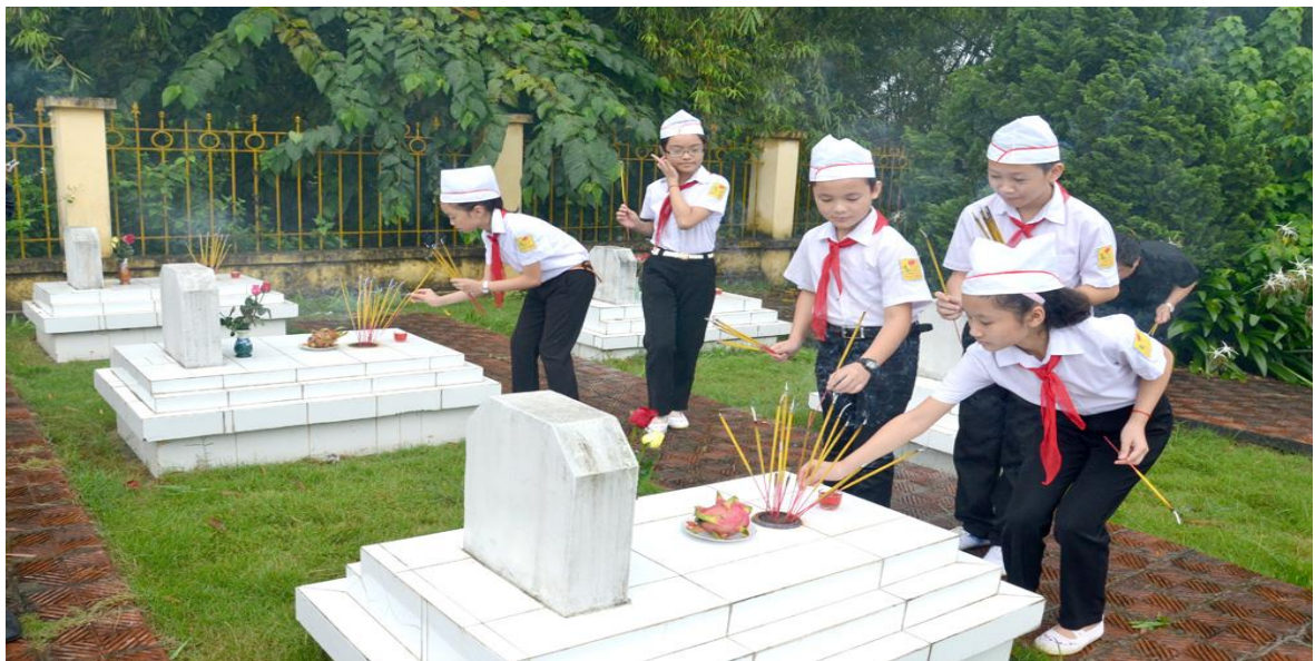
Học sinh dâng hương tại đài tưởng niệm các anh hùng liệt sĩ

Ngoài ra, Nhà trường giáo dục tinh thần yêu nước cho học sinh từ những hành động, cử chỉ nhỏ. Cụ thể, đối với nghi thức chào cờ, chào cờ, hát quốc ca, đội ca nghiêm túc. Thông qua các buổi sinh hoạt lớp, các tiết học ngoại khóa, Tôi luôn nhắc gửi thông điệp tới học sinh rằng; “Tổ quốc luôn trong trái tim mình. Vì thế dù đi đâu, làm gì hai tiếng thiêng liêng Tổ quốc sẽ nhắc nhở mỗi người phải có ý thức, trách nhiệm bảo vệ và xây dựng đất nước” .